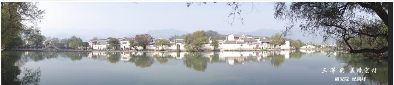
三等奖 美境宏村 研究院 纪剑峰