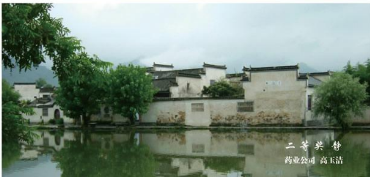
二等奖 静 药业公司 高玉洁