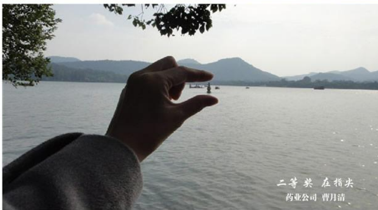
二等奖 在指尖 药业公司 曹月清